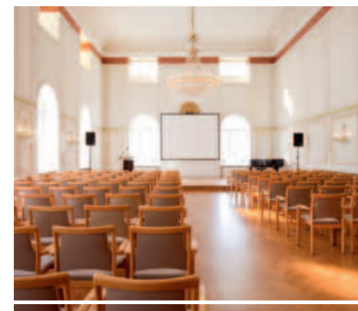
Bürgerschaftssaal gegenüber vom Hotel, fußläufig

Discreet colours and noble woodwork characterise the five event rooms of the Steigenberger Hotel Stadt Hamburg – and create an appealing atmosphere for conferences, meetings or parties. With sizes between 27 and 130 m 2 and the possibility to combine parts of the room you can find space for up to 150 people. The modern equipment including aircondition off all the rooms and the attentive service of our house also goes without saying.