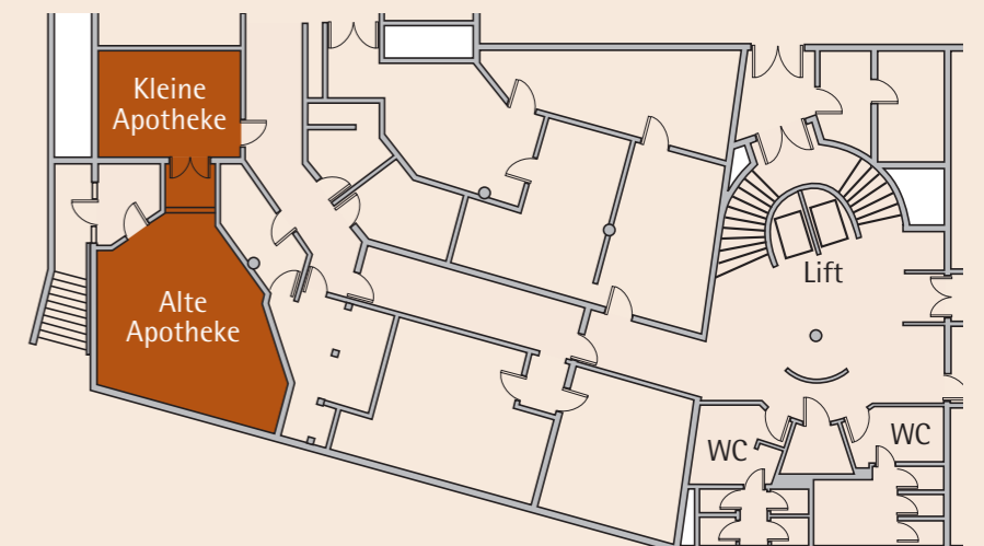
Untergeschoss · Lower Basement