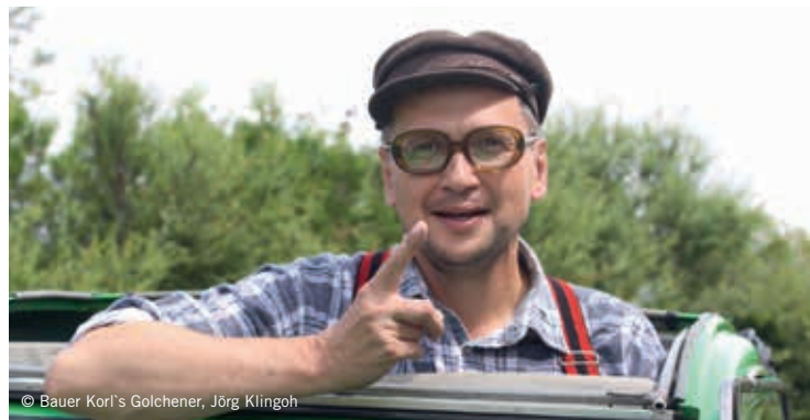
© Bauer Korl's Golchener, Jörg Klingohr